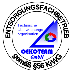
Überwachungszeichen der TÜO

Dieses Schmukzertifikat ist nur gültig mit dem Zertifikat und den Anlagen nach EfbV Anhang 3